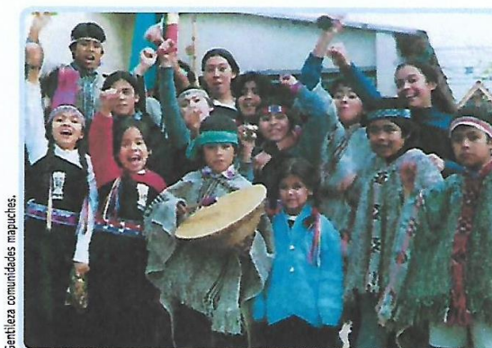
Un grupo de niños mapuches.

Todas ellas luchan por lograr el derecho a la tierra –un elemento básico para garantizar su continuidad como grupo–, por el respeto a su forma de vida tradicional y por el cuidado del ambiente.